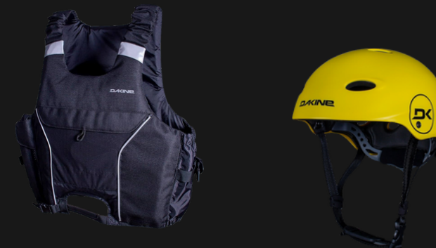
COLETE e CAPACETE

Equipamentos simples que garantem segurança .